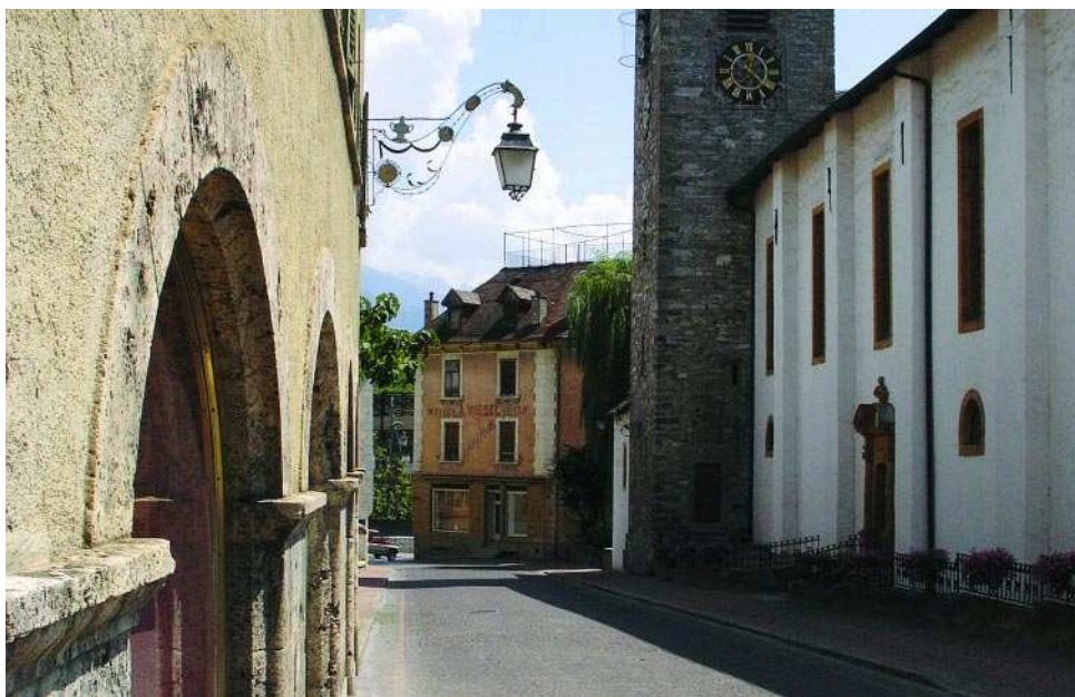
Bientôt une deuxième vie pour la Maison Wiesel (la bâtisse rose à côté de l'église).

Si tout va bien, la rénovation de la Maison Wiesel sera achevée pour la rentrée de l'automne 2008.