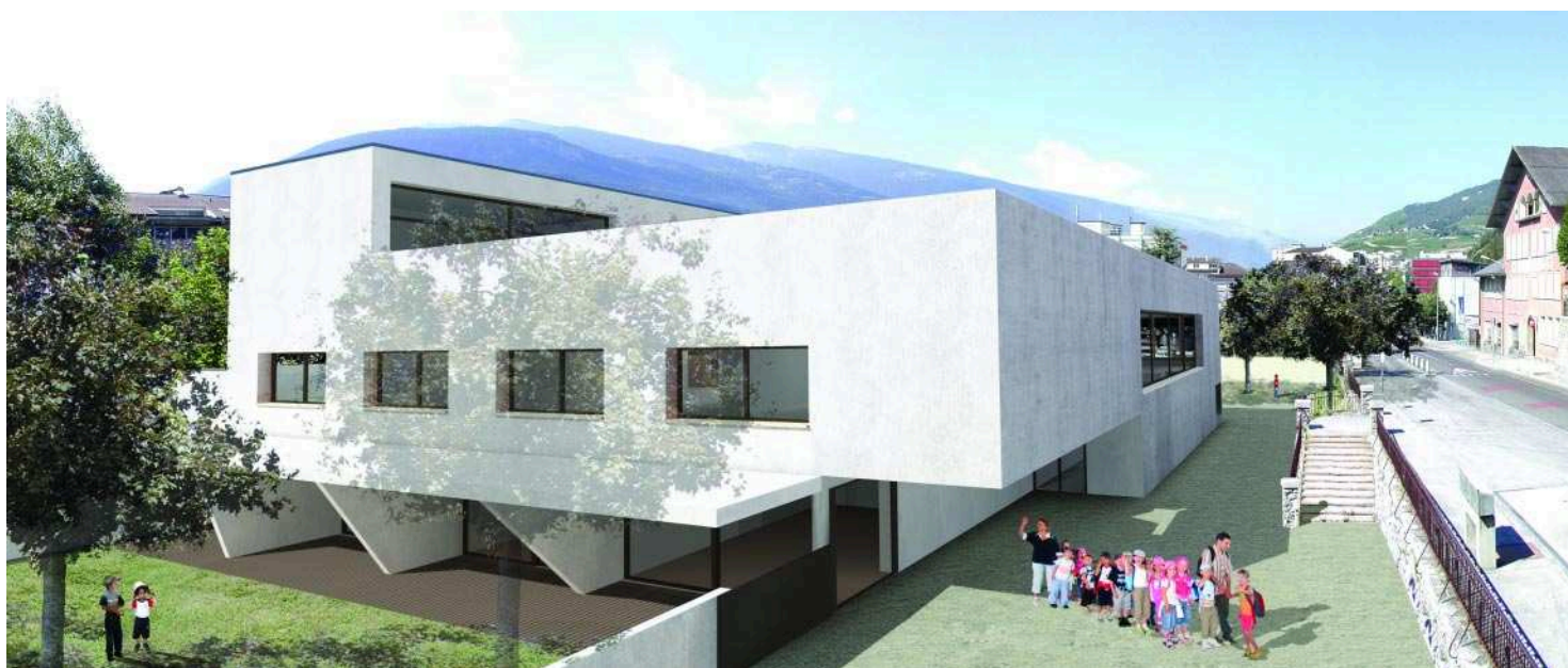
La nouvelle crèche: lumineuse, avec cours et patios privatifs pour la sécurité des enfants.

L'investissement total est de l'ordre de 17 millions de francs: 8 millions pour le parking et 9,1 millions pour la crèche dont 450'000 francs de subventions cantonales et fédérales.