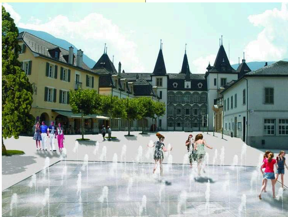
Photo-montage de ce que pourrait être la future place de l'Hôtel de Ville.