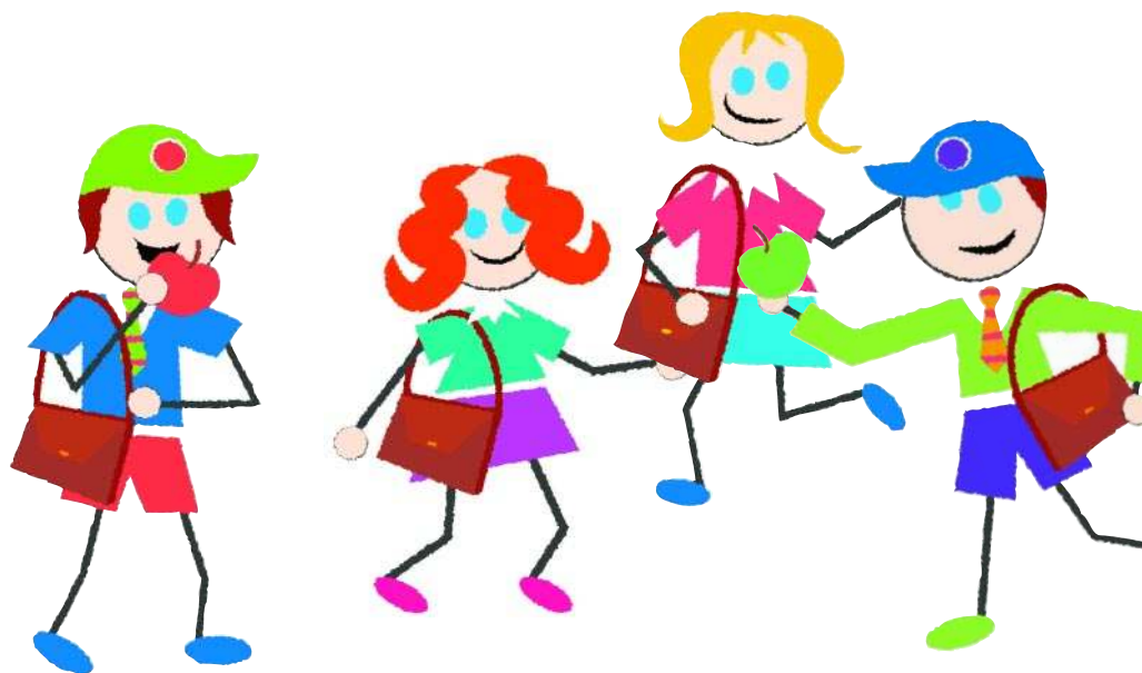
2000 élèves ont retrouvé les bancs d'école.

► Les éléments «difficilement» gérables sont une petite frange mais ils peuvent compromettre leur propre parcours ou une ambiance de classe. Ils demandent attention et énergie. A Sierre, heureusement, pour l'heure on ne peut pas parler de terrorisme scolaire. Notre objectif est de préserver l'acquis. Divers projets et réalisations éducatifs sont en cours: médiations scolaires, espaces d'accueil, réseau d'intervention réunissant les différents acteurs concernés: parents, enseignants, Aslec, police... La Ville est en train de se doter d'une réelle politique de l'Intégration et de la Jeunesse.