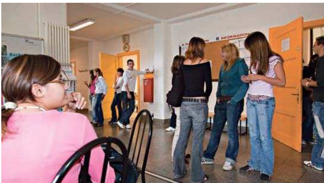
Actuelle Ecole de Commerce

La nouvelle ECCG trouve sa localisation au sud des voies. Le bien-fondé de faire avancer ce projet rapidement existe soit du côté Municipalité qui doit mettre en avant la gare routière, et un parking, soit du côté Canton convaincu des besoins et de l'exiguïté des sites actuels. La région, par sa Préfète, soutient le projet depuis la première heure.