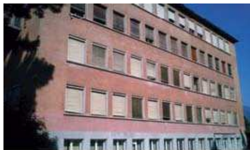
Ecole de Commerce (EC)