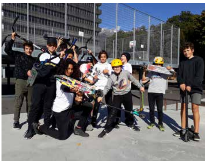
// Ils ont entre 12 et 15 ans et arrivent de tous les quartiers de Sierre pour s'entraîner sur la nouvelle «plaza» en face du cimetière.

s'est acheté une pizza en ville et on vient la manger ici. Cela nous fait du bien de changer d'air, d'être en contact avec la nature. Et en même temps, on est à deux pas de l'école, on a le temps d'y retourner sans stress.»