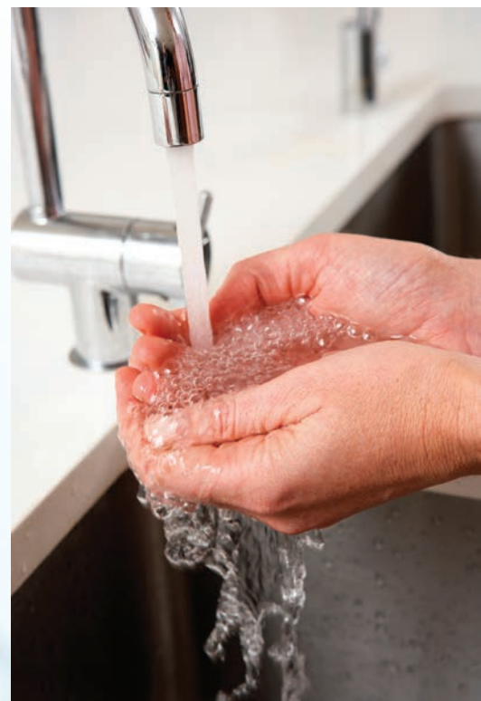
Le nouveau tarif est uniquement basé sur la consommation d'eau: au forfait de base annuel s'ajoutent les m 3 supplémentaires.