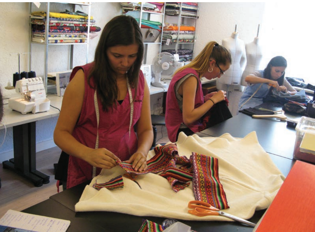
L'Ecole de Couture est en contact avec l'ECAV pour la maturité artistique post-CFC, et avec l'Institut Notre-Dame-de-Lourdes pour l'organisation d'un défilé de mode.