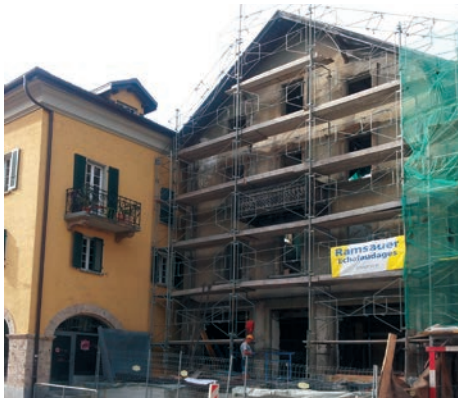
La maison de l'antiquaire Fernand Antille a le style des années 1890, mais elle doit dater du tout début du XX e siècle. Elle est représentative de la modernisation de la localité il y a un peu plus de cent ans. Nouvelle affectation prévue après rénovation: des logements pour étudiants.

Sierre bouge avec son temps tout en accueillant son passé. Voici quelques exemples actuels situés dans ou proches du Vieux-Bourg, commentés par l'historien de l'art Gaëtan Cassina.