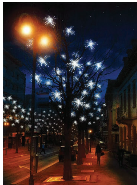
Ce photomontage donne un avant-goût de l'ambiance de Noël sur l'avenue Général-Guisan.

Le montage et le démontage de l'éclairage de Noël sur l'ensemble de la commune représentent 560 heures de main-d'œuvre. Pour que les décorations brillent au sommet des 70 lampadaires début décembre dans toute la ville, Sierre Energie SA (SIESA) commence à les installer début novembre. Cet éclairage de fête prend fin à l'Épiphanie. Après cette date, il faut encore compter trois semaines de travail pour démonter et ranger le tout.