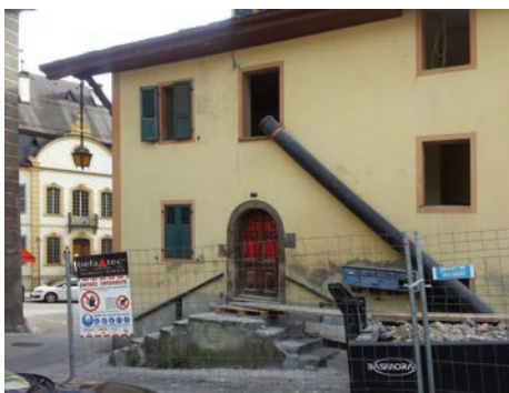
La maison Lovina était naguère sous-louée à des personnes exerçant «le plus vieux métier du monde». Son appellation traditionnelle et sa datation de la 2 e moitié du XVII e siècle ont été confirmées par les inscriptions gravées sur des poutres. La partie la plus ancienne remonte à 1670 environ. À l'est, le bel escalier tournant, dans sa tour aujourd'hui intégrée à des annexes plus récentes, est peut-être un apport du XVIII e siècle