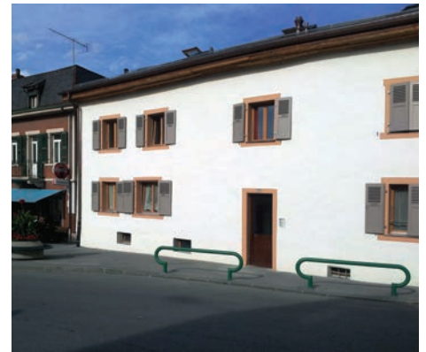
Cette maison fraîchement refaite aurait appartenu à Monsieur Hilty, qui donnait des leçons d'allemand et a ouvert la première école réformée de Sierre. Elle est constituée de deux parties: au sud, l'ancienne façade témoigne d'une première construction datant de 1800 environ, et au nord, un agrandissement du milieu du XIX e siècle.